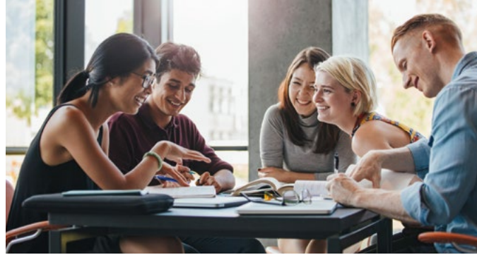
Eine Lerngruppe bei der gemeinsamen Arbeit